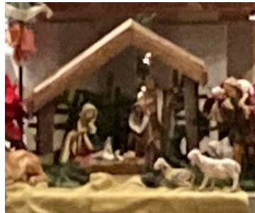
Pictures from Christmas Eve Masses - Fotos de las misas de Nochebuena