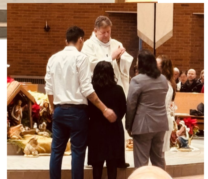
Izquierda: 28/12/24 4pm Bautismo Misa Derecha: Reconocimiento del 25° aniversario en la Misa del 12/28/24.