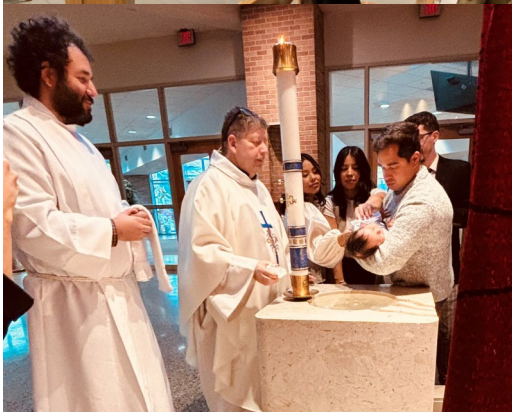
Left: 12/28/24 4pm Mass Baptism Right: 25th Anniversary recognition at the 12/28/24.