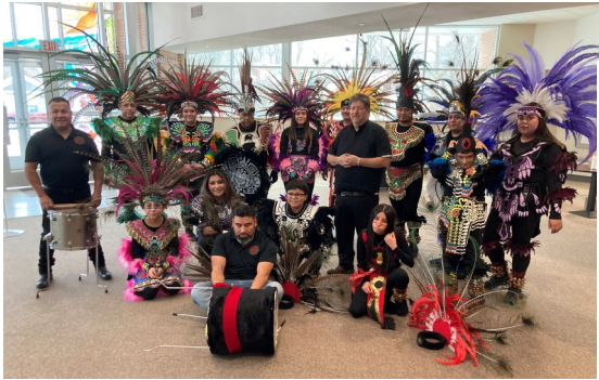
Danza Mictian De Grand Rapids Dancers perform at the 12:30pm Fourth Sunday of Advent Mass.