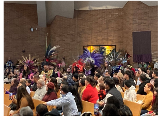
Los bailarines de Danza Mictian De Grand Rapids se presentan a las 12:30 p.m. el Cuarto Domingo de la Misa de Adviento.